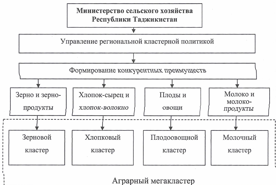
Рис. 3. Структура аграрного мегакластера Республики Таджикистан

На основе показателей специализации регионы Республики Таджикистан могут быть разделены на 4 аграрных кластера, специализированных на производстве зерна, хлопка, плодоовощной продукции, молока, что доказывает целесообразность создания аграрного мегакластера (рис. 3).