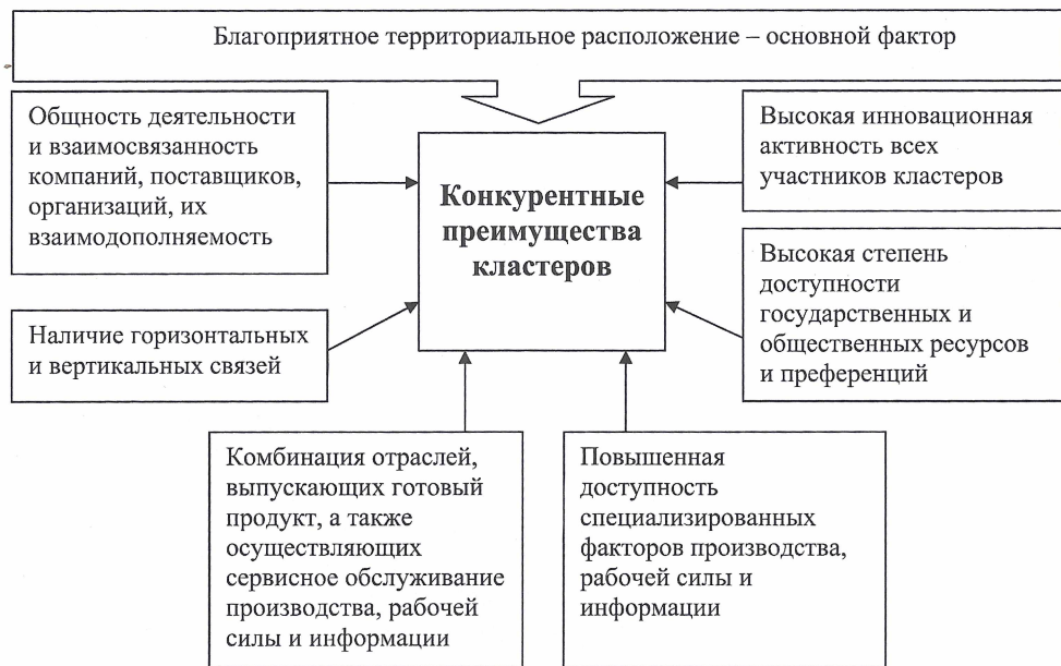
Рис. 1. Конкурентные преимущества кластеров в аграрном секторе экономики

Модель формирования регионального аграрного кластера предлагаем разбить на четыре этапа.