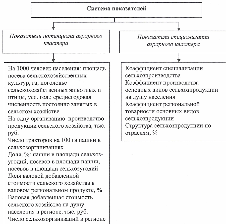
Рис. 2. Система показателей, определяющих возможность формирования аграрного кластера

В регионах необходимо выявление специализированных аграрных кластеров, способных обеспечить в первую очередь рынки крупных городов основными продуктами питания. Основным критерий выявления специализированных кластеров — способность региона обеспечить собственное население конкретным продуктом, а также вывоз этого продукта в другие регионы и за пределы страны. В этих целях предложена следующая система показателей (рис.2).